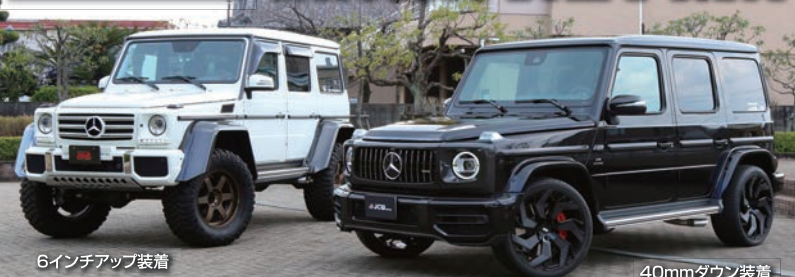
6インチアップ装着