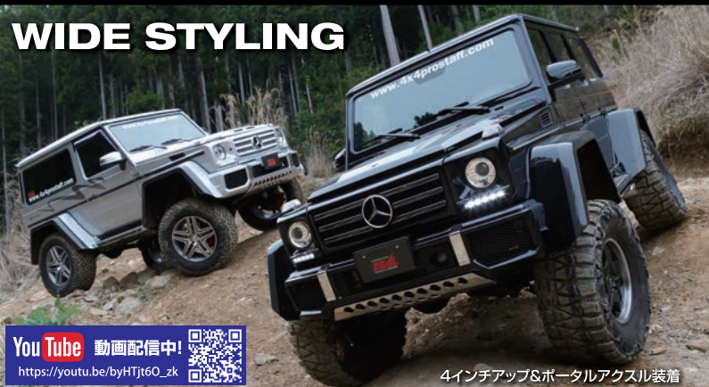
4インチアップ&ポータルアクスル装着

YouTube 動画配信中! https://youtu.be/byTjr60_zk