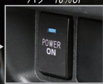
ローパワー UP (燃費優先型)