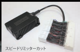
スピードリミッターカット