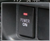
ハイパワー UP (パワー優先型)