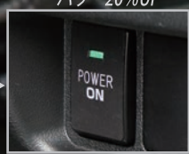
ミドルパワー UP (パワー/トルク/燃費平均型)