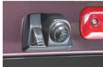
RCK-99A3 ダイハツ アトレーワゴン(S320G/S330G/S321G/S331G) ハイゼットカーゴ(S320V/S330V/S321V/S331V) トヨタ ピクシスバン(S321M/S331M) スバル サンバーバン (S321B/S331B) ティアスワゴン(S321N/S331N)