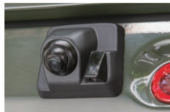
RCK-91J3 スズキ ジムニー/ジムニーシエラ(JB64W/JB74W)