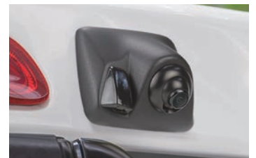
RCK-93H3 トヨタ ハイエース(KDH/TRH/GDH20#/21#/22#)