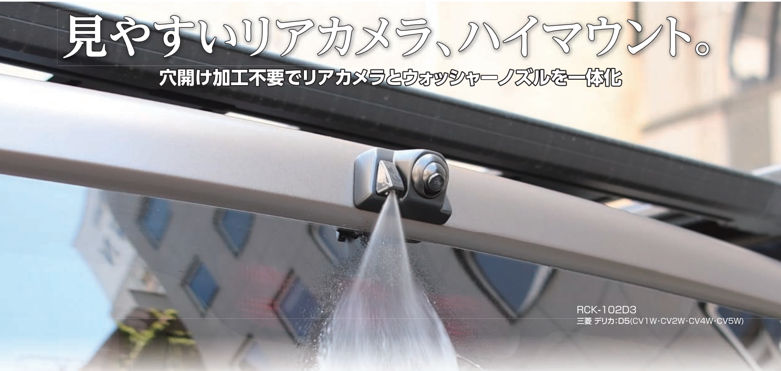
RCK-102D3 三菱 デリカ:D5(CV1W・CV2W・CV4W・CV5W)

ウォッシャーノズルの取り付け穴を利用してリアカメラを装着する、全く新しいタイプのアイテム。 カメラカバーにカメラとウォッシャーノズルをセットして一体化、高い位置にリアカメラを取り付けできますので、純正の低いリアカメラ取り付け位置に比べて後方の視認性が向上!