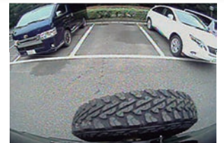
ハイマウントリアカメラ映像