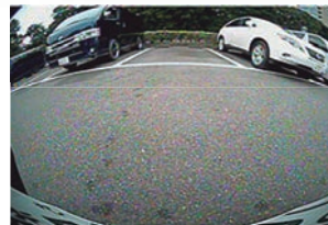
純正リアカメラ映像

ウォッシャーノズルの取り付け穴を利用してリアカメラを装着する、全く新しいタイプのアイテム。 カメラカバーにカメラとウォッシャーノズルをセットして一体化、高い位置にリアカメラを取り付けできますので、純正の低いリアカメラ取り付け位置に比べて後方の視認性が向上!