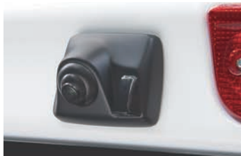
RCK-107V3 [NEW] 日産 NV200バネット(M20/VM20/VNM20) 三菱 デリカD:3(BM20)