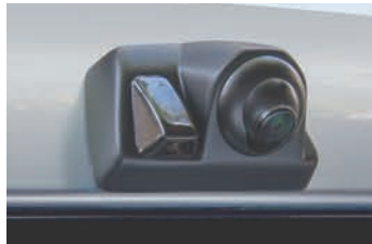
RCK-105P3 [NEW] トヨタ プロボックス(50系) プロボックス(160系) サクシード(160系) マツダ ファミリアバン(160系)