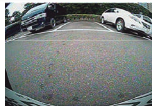
純正リアカメラ映像

ウォッシャーノズルの取り付け穴を利用してリアカメラを装着する、全く新しいタイプのアイテム。カメラカバーにカメラとウォッシャーノズルをセットして一体化、高い位置にリアカメラを取り付けできますので、純正の低いリアカメラ取り付け位置に比べて後方の視認性が向上!