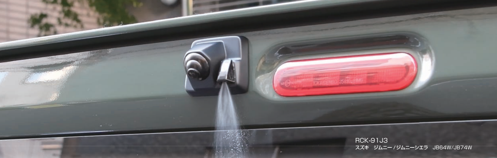
RCK-91J3 スズキ ジムニー / ジムニーシエラ JB64W / JB74W

ウォッシャーノズルの取り付け穴を利用してリアカメラを装着する、全く新しいタイプのアイテム。カメラカバーにカメラとウォッシャーノズルをセットして一体化、高い位置にリアカメラを取り付けできますので、純正の低いリアカメラ取り付け位置に比べて後方の視認性が向上!