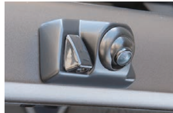
RCK-102D3 三菱 デリカ:D5(CV1W・CV2W・CV4W・CV5W)