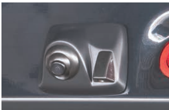
RCK-95E3 スズキ エブリイ/エブリイワゴン(DA17V) エブリイ/エブリイワゴン(DA17W) 日産 NV100クリッパー(DR17V/NV100クリッパー(DR17W) マツダ スクラムバン(DG17W)/スクラムワゴン(DG17W) 三菱 ミニキャブバン(DS17V)/タウンボックス(DS17W)