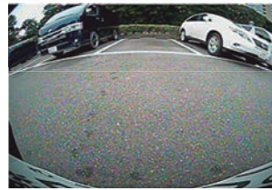
純正リアカメラ映像

ウォッシャーノズルの取り付け穴を利用してリアカメラを装着する、全く新しいタイプのアイテム。カメラカバーにカメラとウォッシャーノズルをセットして一体化、高い位置にリアカメラを取り付けできますので、純正の低いリアカメラ取り付け位置に比べて後方の視認性が向上!