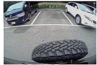
ハイマウントリアカメラ映像