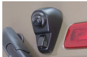
RCK-97A3 タイハツ アトレー/ハイゼットカーゴ(S700V/S710V) スバル サンバーバン(S700B/S710B) トヨタ ピクシスバン(S700M/S710M)