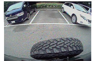
ハイマウントリアカメラ映像