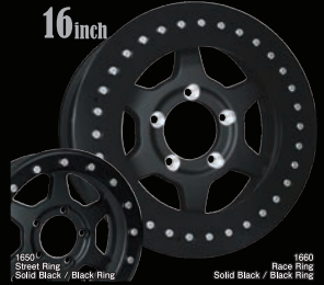
1660 Race Ring / Black Ring

詳しくはソリッドレーシングホームページにてご確認下さい。 http://www.solidracing.co.jp