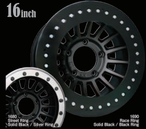
1690 Race Ring / Black Ring