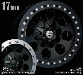
1790 Race Ring / Black Ring